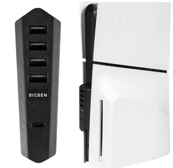
*STATION HUB USB POUR PS5® - HUB USB PER PS5®

Guía del usuario / Manuale d'uso / Manual do utilizador